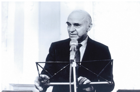
Das Konzept der Input-Output-Rechnung geht maßgeblich auf Wassily Leontief zurück.

Der Ökonom Wassily Leontief (1906 bis 1999) entwickelte in den dreißiger und vierziger Jahren des letzten Jahrhunderts die Input-Output-Rechnung und -analyse in ihrer modernen Form. Hierfür wurde er 1973 mit dem Nobelpreis für Wirtschaftswissenschaften ausgezeichnet. Leontief knüpfte mit seinen Arbeiten an frühere Versuche an, das Konzept einer Volkswirtschaft als geschlossenen Wirtschaftskreislauf in tabellarischer oder mathematischer Weise abzubilden. Genannt seien insbesondere das sektoral gegliederte „Tableau économique“ von François Quesnay 1 (1758) und die Modellrechnungen von Léon Walras (1874).